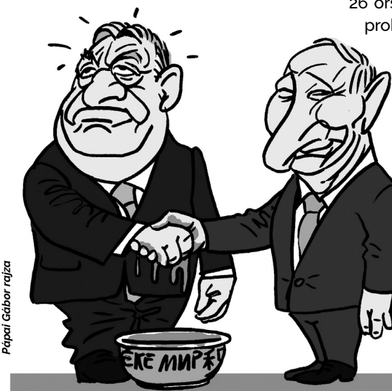
Papai Gábor rajza