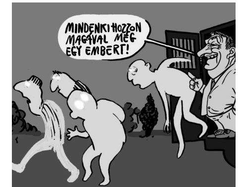
Illusztráció: Papai Gábor

A kormány azzal magyarázza a lépését, hogy sokba kerül a fogva tartásuk.