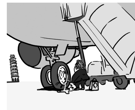
Illusztráció: Papai Gábor

Nyilvánvaló hazugságról van szó, ugyanis egy hivatásos pilóta szerint a