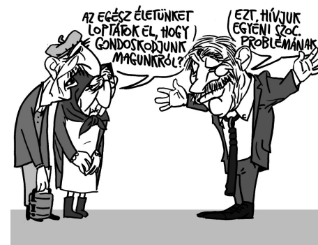
Illusztráció: Pápai Gábor

A parlamenti vitában a fideszes képviselők sem tudták megindokolni, hogy erre most miért van szükség. Ráadásul az