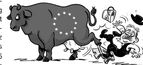
Mese a miniszterelnökről és a fejőstehénről

Azt várják, hogy olyan hatékony intézkedéseket hozzanak, ami megakadályozza, hogy az uniós források jelentős részét egy szűk haveri kör kapja meg.