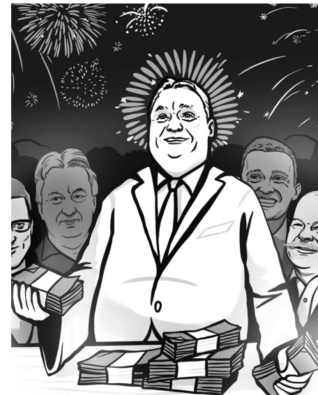
Illusztráció: Buzás Aliz

Az Európai Unió statisztikai hivatala döbbenetes adatokat tett közzé a napokban. A magyar infláció a hatodik legnagyobb az egész Európai Unióban, csak a három balti állam, valamint Csehország és Bulgária fogyasztói árai nőnek durvább ütemben, mint az itteniek. Nálunk azonban a benzin és néhány alapélelmiszer