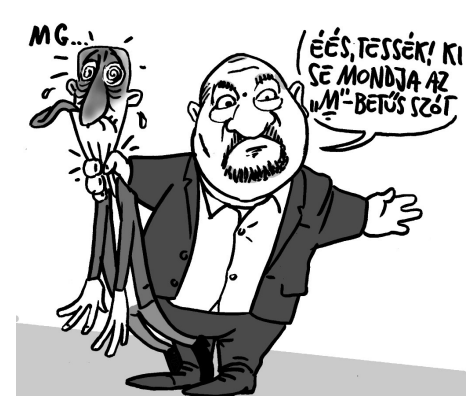
Illusztráció: Pápai Gábor

Orbán Viktor még ebben a válságos helyzetben sem őszinte, rendszeresen épp az ellenkezőjét mondja annak, mint