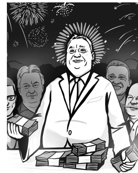
Illusztráció: Buzás Alíz

Az Európai Unió statisztikai hivatala döbbenetes adatokat tett közzé a napokban. A magyar infláció a hatodik legnagyobb az egész Európai Unióban, csak a három balti állam, valamint Csehország és Bulgária fogyasztói árai nőnek durvább ütemben, mint az itteniek. Nálunk azonban a benzin és néhány alapélelmiszer