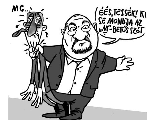
Illusztráció: Pápai Gábor

Orbán Viktor még ebben a válságos helyzetben sem őszinte, rendszeresen épp az ellenkezőjét mondja annak, mint