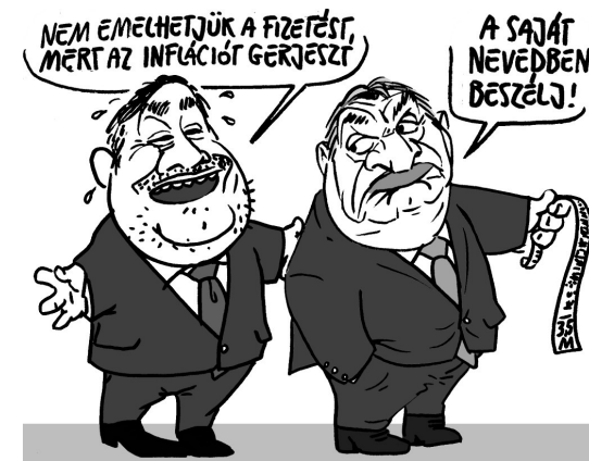
Illusztráció: Pápai Gábor

digi 1,5 milliós fizetését 2 millió forinttal növelték meg, és ehhez jön még az 1,3 milliós képviselői díj, vagyis havi 4,8 millió forintot keres hivatalosan.) A választások előtti osztogatáskor miért nem tartott a kormány az ár-bér spirál kialakulásától?