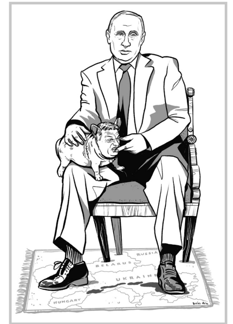
Illusztráció: Buzás Aliz

Orbán olyan korrupt rendszert épített ki, annyit loptak, hogy az Európai Unió nem hajlandó pénzt küldeni Magyarországnak. Orbán barátja, a felcsúti gázszerelő lett az ország leggazdagabb embere, milliárdossá tette az apját, a testvéreit, a gyerekeit, de még a vejét is. Csak akkor