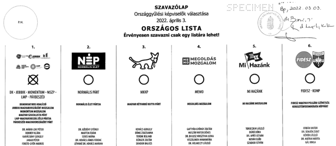
Érvényesen szavazni a lista neve feletti körbe tollal írt kék, egymást metsző vonallal lehet, például: vagy

A harmadik szavazólapon a „gyermekvédelminek” hazudott népszavazás kérdései lesznek. Amennyiben ön is értelmetlennek és megtévesztőnek tartja a népszavazási kérdéseket, akkor úgy tudja érvényteleníteni a szavazólapot, hogy valamennyi kérdésnél beikszeli az igent és a nemet is.