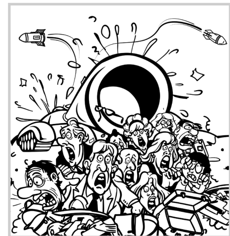
Illusztráció: Venczel Zoltán

Még nagyobb baj volt, hogy Orbán elkezdte másolni az orosz rendszert. Megszüntette például a sajtószabadságot.