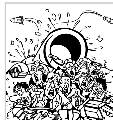
Illusztráció: Venczel Zoltán

Még nagyobb baj volt, hogy Orbán elkezdte másolni az orosz rendszert. Megszüntette például a sajtószabadságot.