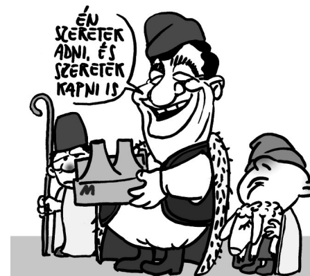
Illusztráció: Pápai Gábor