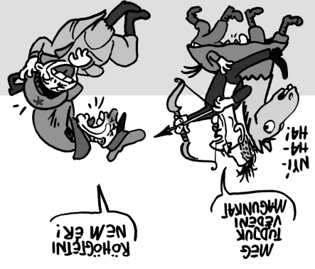
Illusztráció: Papai Gábor