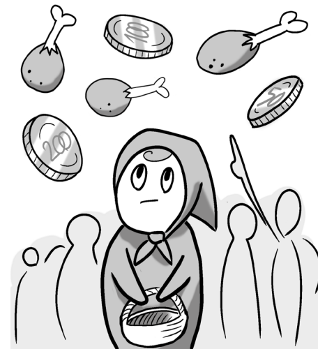
Illusztráció: Baiksa Nóra

darca az, hogy milliók élnek ma Magyarországon, akiknek egy étolaj megvásárlása is gondot jelent.