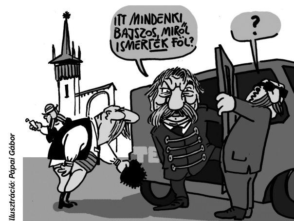
Illusztráció: Pápai Gábor