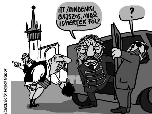
Illusztráció: Pápai Gábor