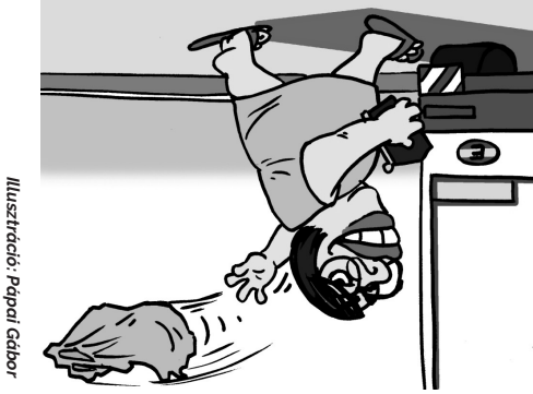
Illusztráció: Papai Gábor