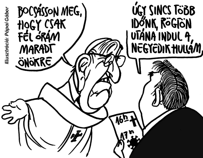
Illusztráció: Pápai Gábor