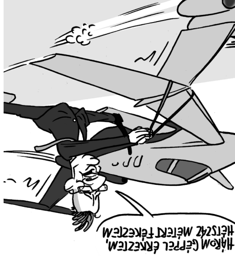
Illusztráció: Papai Gábor – Népszava

A községekben élők átlagéletkora 2020-ban 42 év volt. Azonban akadtak települések, főként Vas és Zala megyében, ahol az 50 évet is meghaladta az átlagéletkor. A GKI szerint ahol a fiatalok aránya a 10 százalékot sem éri el, azokban a falvakban a település megmaradása lehet a tét.