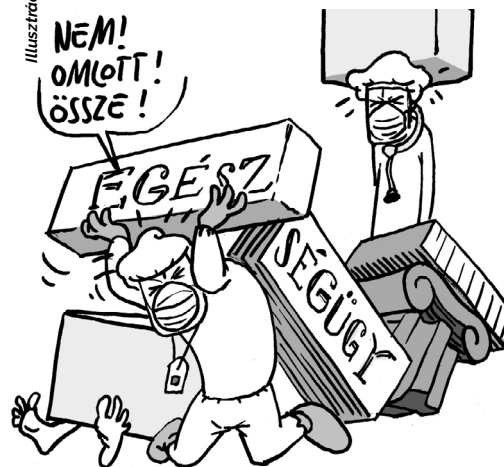
Illusztráció: Pappai Gábor – Népszava