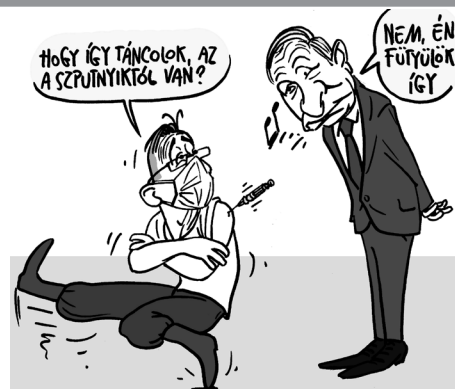
Illusztráció: Pápai Gábor – Népszava

A külügyminisztérium legutóbbi táblázata szerint jelenleg nyolc ország van, ahová a magyar védettségi igazolvánnyal be lehet utazni: Bahrein, Cseh Köztársaság, Észak-Macedón Köztársaság, Hor-