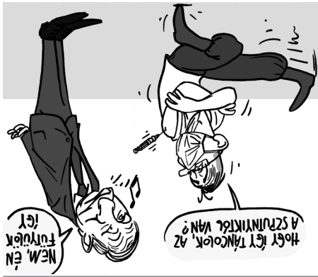
Illusztráció: Papai Gábor - Népszava

A külgügyminisztérium legutóbbi tab- lázata szerint jelenleg nyolc ország van, ahova a magyar védettségi igazolvánnyal be lehet utazni: Bahrein, Cseh köztársá- ság, Szlovénia, Törökország, vátország, Montenegró, Szerb köztársá- ság, Észak-Macedón köztársaság, Hor-