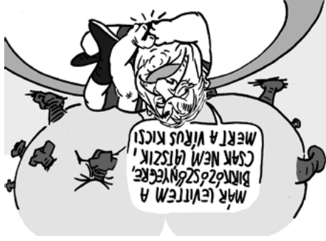
Illusztráció: Papai Gábor – Népszava

Van olyan nyugati oltóanyag, aminél 17-szer drágábban vesszük a kínai oltást. Az orosz vakcina beszerzéséhez nem kellett közvetítő cég, a kínainál viszont közbeiktattak egyet.