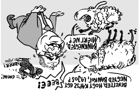
Illusztráció: Pápai Gábor – Népszava

sen ebből sem volt egy szó sem igaz. Kösa négyeszer ment el vele Svájcba, különböző bankokhoz, mire rájött, hogy becsapják őt.