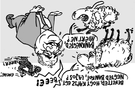
Illusztráció: Pápai Gábor – Napszava