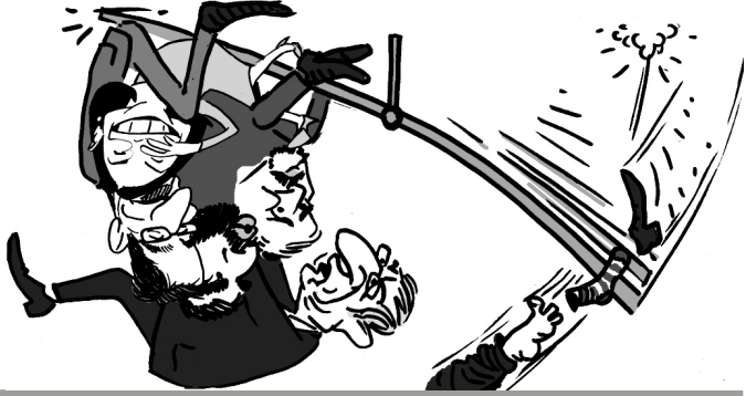
Illusztráció: Papai Gábor – Népszava

Hat pontban fogalmazták meg a közös kormányzás legfontosabb alapelveit az ellenzékli pártok – DK, Jobbik, LMP, Momentum, MSZP, Párbeszéd – korábban már megegyezték abban, hogy közös listán, közös jelöltekkel, közös miniszterelnök-jelölttel indulnak a 2022-es választáson.