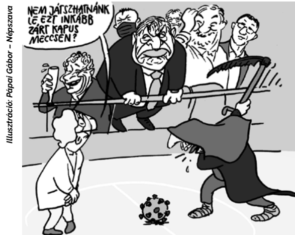
Illusztráció: Pápai Gábor - Népszava

Az utolsó pillanatban, mielőtt még az eddiginél is komolyabb tragédiába fordult volna a vírusjárvány, Orbán végre valódi szigorításokra szánta el magát. Reméljük, nem túl későn, mert a kórházak már most a teljesítőképességük határán vannak. Viszont még mindig várat magára az a lépés, hogy a munkájukat elvesztők hathatós segítséget kapjanak.