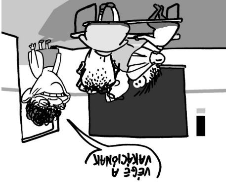
Illusztráció: Péter Gábor – Népszavna

Az öt pontból álló követeléslista szerint az általános iskolák körében, Gondoskodjanak érintés-