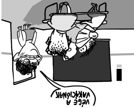
Illusztráció: Péter Gábor – Népszavna

Az öt pontból álló követeléslista szerint az általános iskolák körében, Gondoskodjanak érintés-