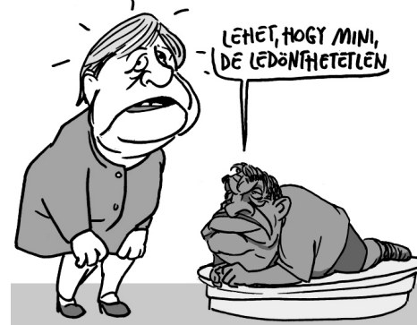
Illusztráció: Pápai Gábor – Népszava

Veszélyes játékba kezdett a magyar miniszterelnök. Szavazataért cserébe azt akarja, hogy az Unió ne vizsgálhassa hazánkban a demokráciával kapcsolatos problémákat, és a vele szemben kritikus civilek se kaphassanak pénzt az EU-tól.