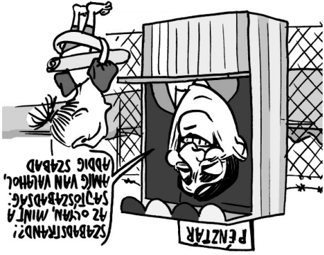
Illusztráció: Pápai Gábor – Nepszava

Rohamosan csökken az ingyenes fürdőhelyek száma a Balatonnál, idén már csak 64 olyan partszakasz akad, ahol belépődíj nélkül lehet mártózni. A negyven, tóparttal rendelkező önkormányzat közül husz egyáltalán nem biztosít ingyenes strandot.