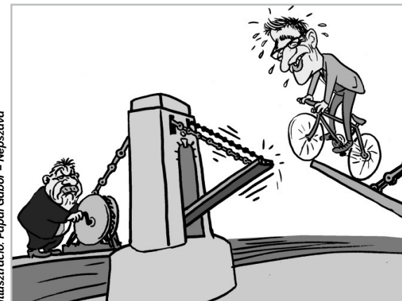
Illusztráció: Pápai Gábor – Népszava

De a Budapesten is ugyanaz a tisztességtelen eljárás folyik. Ennek lett a jelképe a felújításra szoruló Lánchíd. A Fidesz azt akarja bizonyítani, hogy a főváros új vezetése még egy hidat sem képes felújítani, miközben sorra fosztja meg a várost a bevételeitől.