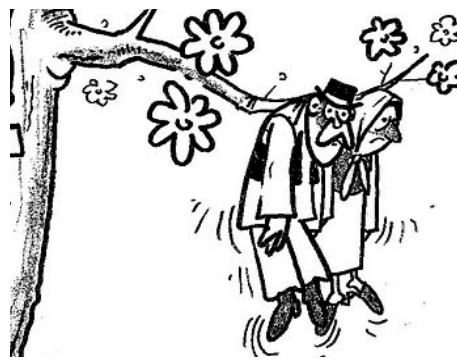
Illusztráció: Pósa Károly

A „Földet a gazdáknak!” programban Baranya megyében sem azok kapták a földet, akik megművelik. A földek 83 százalékát máshol élő, tőkeerős nyertesek vitték el, és még a „helybeliek” között is akad, akinek semmi köze a mezőgazdasághoz.