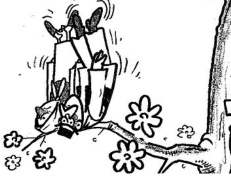
Illusztráció: Pécsa Károly

A „Földet a gazdáknak!” programban Baranya megyében sem azok a kapták a földet, akik megművelik. A földek 83 százalékát másból elő, tökéletes nyereségek vittek el, és még a „helybeliek” között is akad, akinek semmi köze a mezőgazdasághoz.