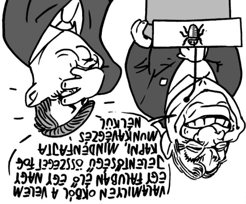
Illusztráció: Papai Gábor – Nagyszava

Az állam lenyege az, hogy az életünket törvények irányítják, amelyek mindenkire érvényesek, azokat mindenkinek kell tartania. A bírósági ítéleteket például nem lehet megkérdőjelezni, azok kivétel nélkül mindenkire kötelezők. Mivel Magyarországon jogállamnak tartja magát,