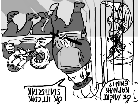
Illusztráció: Papai Gábor – Népszavva

Nem véletlen, hogy az Európai Unió kötelezettségességi eljárást folytat a korábbi ellen, amiért éheztek az embereket a tranzit-zónában. 2018 augusztusa óta összesen 18 (!) alkalommal próbálkozott azzal a kormány, hogy egyszerűen nem ad enni a lakétkalanul adjanak enni egy afgán menekültnek.