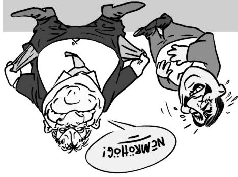
Illusztráció: Pappi Gábor - Népszava

Még 2018-ban büszkén jelentette be a Magyar Nemzeti Bank, hogy átlagosan minden magyar embernek 4 millió 200 ezer forint megtakarítása van. Most, 2020 elején a magyar miniszterelnök azt közölte, hogy neki egyetlen forint megtakarítása sincsen.