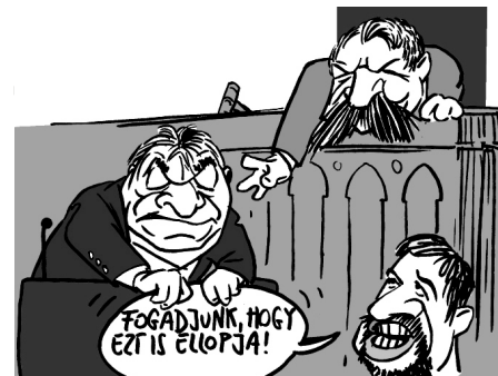
Illusztráció: Pápai Gábor – Népszava

A miniszterelnök családjából ketten is felkerültek a Forbes magazin 100-as toplistájára, amin a legértékesebb magyar tulajdonú cégeket vették számba. Az egyik „szerencsés” vállalkozó Orbán veje, Tiborcz István a BDPST Zrt. nevű ingatlanos cégével. A másik pedig a miniszterelnök apja, Orbán Győző a Dolomit Kőbányászati Kft.-vel.