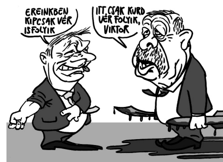
Illusztráció: Pápai Gábor – Népszava

Az Európai Unió valamennyi országa elítélte, hogy Törökország megtámadta Szíria kurdok lakta területeit. Ez a rengeteg civil áldozattal is járó háború egyedül a magyar kormány szerint szolgálja a nemzeti érdekeinket. Az Unió legmagasabb szintjeiről jelezték: döntenünk kell, Európát vagy a fél-diktatúrák világát választjuk.