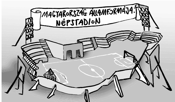
Illusztráció: Pápai Gábor – Népszava