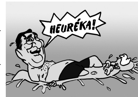
Illusztráció: Pápai Gábor – Népszava

Egy új szabályozás lehetővé teszi, hogy a kempingeket beépítsék és pél-