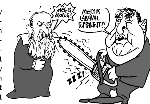
Amikor elítélte az inkvizíció Galileit, mert azt tanította, hogy a Föld forog, a legenda szerint a tudós mérgesen toppantott, és ezt kiáltotta: És mégis mozog!

A kiszivárgott dokumentumokból egyebek mellett kiderül, hogy az MTA-ról