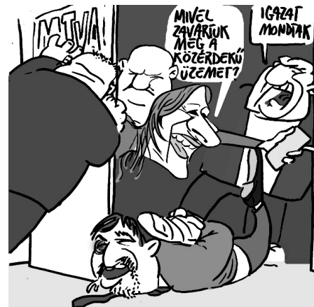
Illusztráció: Pápai Gábor – Népszavaz

A rabszolgatörvény elleni felháborodással kezdődött, de egyre többen ismerték fel, hogy a Fidesz egész rendszerével van a baj. Ezért tüntetnek együtt fiatalok és idősek, szakszervezetiek és egyetemisták, párttagok és pártönkívüliek, akik mind ugyanazt kiabálják: „Elegünk van!”