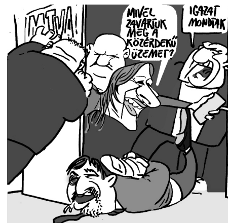
Illusztráció: Pápai Gábor – Népszavna

A rabszolgatörvény elleni felháborodással kezdődött, de egyre többen ismerték fel, hogy a Fidesz egész rendszerével van a baj. Ezért tüntetnek együtt fiatalok és idősek, szakszervezetiek és egyetemisták, párttagok és pártönkívüliek, akik mind ugyanazt kiabálják: „Elegünk van!”.