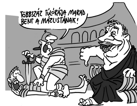
Illusztráció: Pápai Gábor – Népszava

Az elmúlt idők legnagyobb szakszervezeti tüntetését hozta össze december 8-án az elhíresült rabszolgatörvény elleni tiltakozás. Az ellenzéki pártok parlamenti akciókkal igyekeztek – sikertelenül – megakadályozni, hogy a tervezet eljusson a szavazásig.