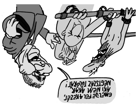
Illusztráció: Pappai Gábor – Népszavazás

szélésen a kormányoldalról már azt jelezték ki, hogy ezt üzemi megállapodás keretében is meg lehetne tenni.