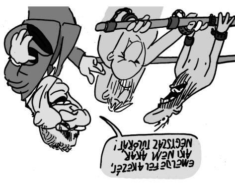
Illusztráció: Pappi Gábor – Népszavna

szélésen a kormányoldalról már azt jelemtették ki, hogy ezt üzemi megállapodás keretében is meg lehetne tenni.